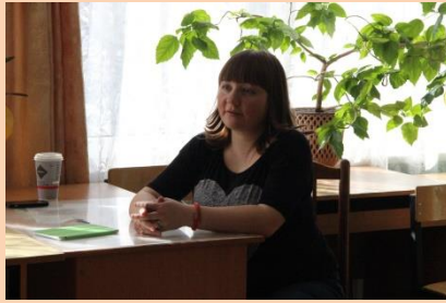
Мастер-класс по радио